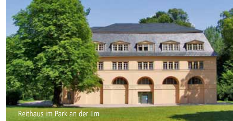
Reithaus im Park an der Ilm